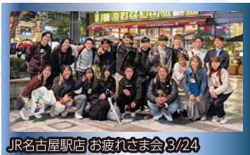
JR名古屋駅店お疲れさま会3/24

東京に行くと良かったです。東京の居酒屋の店長さんは40歳ちよつと過ぎの人だったんですけど、僕の弱い部分とかいろいろ指摘されて、「仕事はしっかりできるんだけど、消極的な性格を直したらいい」とか言われて。メンタル、スタバロになって、毎日酒飲んでました。居酒屋に入って直ぐの頃にそうやっていろいろ言われたので、「ここで辞めてしまったら何も変わらないから、逆に何も言わせないようにならざるうー」って思うのが強くなって、メツチャ頑張りました。