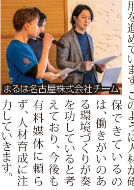
まるは名古屋株式会社チーム

人材確保において、学生さんや主婦さんの繋がりから、新規アルバイトの採用を進めています。このように人材が確保できていくのは、働きがいのある環境づくりが奏を功していると考えており、今後も有料媒体に頼らず、人材育成に注力していきます。