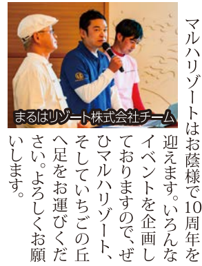
まるはリゾート株式会社チーム

会社全体として51期の主な取り組みは健康経営、SNSの強化、旅行会社との関係強化などを行っています。マルハリゾートとしてはバーベキューやピュッフェ、サイドメニュー、季節のパフェなどのメニューの見直しや新商品の開発、併せて老朽化した設備の修繕や部品の取り替えなどを行っています。いちごの丘は夏に向けての営業、商品開発などを行っています。いちごのかき水や季節の果物を使ったタルトなどを取り込んで、夏も営業をしていきます。