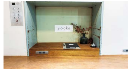
壁面に設置された運搬用のエレベーター

まるは名古屋株式会社の新業態として事業継承した「yoaake」(名古屋市中区)。2017年に廃校となった「那古野小学校」があった場所、その建物を活用した施設「なごのキャンパス」の1Fにある、かつて給食室だった場所をリノベーションした和カフェレストランです。