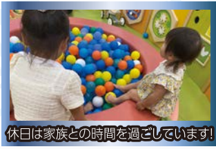
休日は家族との時間を過ごしています。