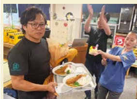
社長にサプライズ