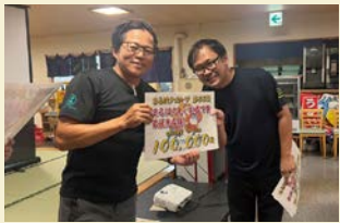
まるはらしいお店で賞 空港店