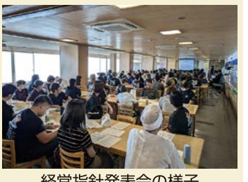
経営指針発表会の様子